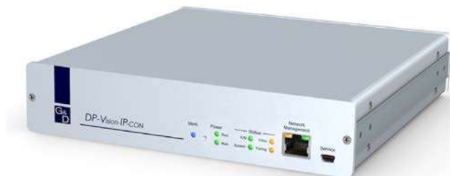
DP-Vision-IP-CAT-CON - Vorderseite