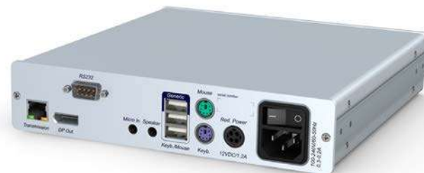
DP-Vision-IP-CAT-CON - Rückseite